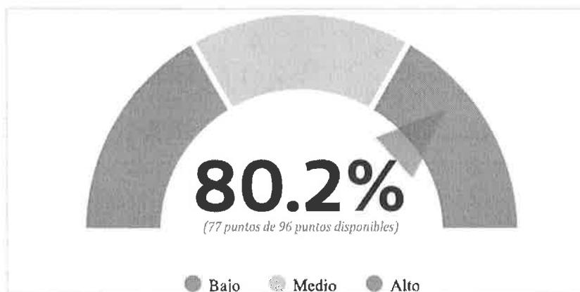
Figura 2. Porcentaje total de puntos obtenidos en las valoraciones cuantitativas.