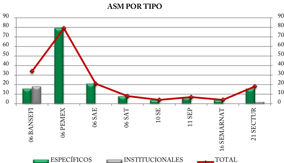
Grafica 2. Aspectos Susceptibles de Mejora para el Segundo Trimestre 2013 por tipo.

Petróleos Mexicanos (PEMEX) es la entidad con el mayor número de ASM con 79 aspectos específicos, seguido por Bansefi que reportó 16 aspectos específicos y 18 institucionales y la Secretaría de Turismo (Sector) que reportó 16 específicos y dos institucionales. El resto de las dependencias sólo reportaron aspectos del primer tipo.